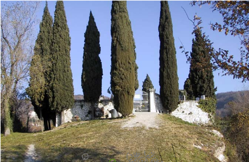
l'ingresso al cimitero